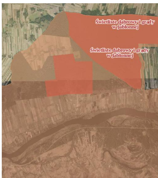
Rysunek 1 Obszary chronione i teren WOCHK

WOCHK został utworzony rozporządzeniem nr 3 Wojewody Mazowieckiego z dnia 13 lutego 2007 r. (Dz. Urz. Woj. Maz. z dnia 14 lutego 2007 r. 42, poz. 870). Obszar ten zajmuje powierzchnię blisko 150 000 ha (148 409,1 ha) i obejmuje tereny chronione ze względu na wyróżniający się krajobraz o zróżnicowanych ekosystemach, wartościowe ze względu na możliwość zaspokajania potrzeb związanych z turystyką i wypoczynkiem, a także pełnią funkcję korytarzy ekologicznych. Część WOCHK rozpościera się na terenie gminy Pomiechówek na gruntach sołectw Wymysły, Cegielnia Kosewko, Kosewo, Modlin Nowy, Wójtostwo, Zapiecki i częściowo w Woli Błędowskiej. Obszar ten podzielony został na: