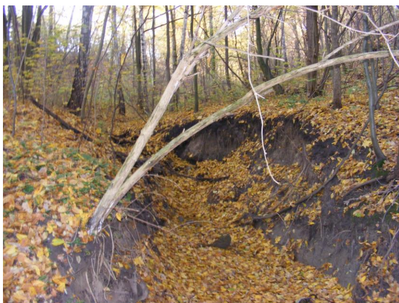
Fot.2 Zadrzewione obniżenia terenowe.

Teren mpzp jest praktycznie bezleśny – niewielki teren leśne położone są w obniżeniach terenowych.