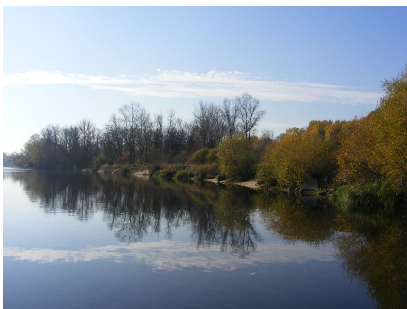
Zdj.3 Nad brzegiem Narwi