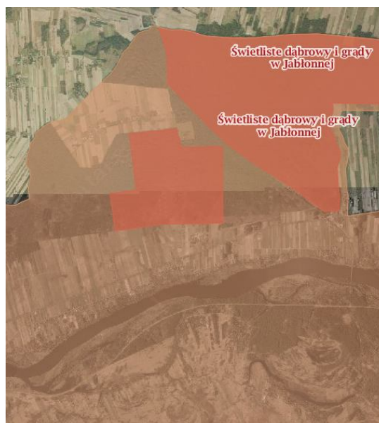
Rysunek 1 Obszary chronione i teren WOCHK

WOCHK został utworzony rozporządzeniem nr 3 Wojewody Mazowieckiego z dnia 13 lutego 2007 r. (Dz. Urz. Woj. Maz. z dnia 14 lutego 2007 r. 42, poz. 870). Obszar ten zajmuje powierzchnię blisko 150 000 ha (148 409,1 ha) i obejmuje tereny chronione ze względu na wyróżniający się krajobraz o zróżnicowanych ekosystemach, wartościowe ze względu na możliwość zaspokajania potrzeb związanych z turystyką i wypoczynkiem, a także pełnioną funkcją korytarzy ekologicznych. Część WOCHK rozpościera się na terenie gminy Pomiechówek na gruntach sołectw Wymysły, Cegielnia Kosewko, Kosewo, Modlin Nowy, Wójtostwo, Zapiecki i częściowo w Woli Błędowskiej. Obszar ten podzielony został na: