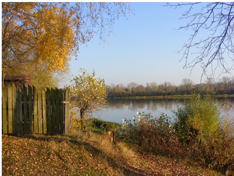
Zdj.1 Zabudowa w bezpośrednim sąsiedztwie rzeki Narew – w strefie szczególnego zagrożenia powodzią.

Obszar opracowania częściowo leży w strefie szczególnego zagrożenia powodziowego. Zagrożenie powodziowe występuje w pobliżu w dolinie Narwi, która od strony Pomiechówka nie jest obwarowana. Na obszarze opracowania w granicach szczególnego zagrożenia powodziowego znajdują się istniejące zabudowania mieszkalne i letniskowe. Plan zakazuje zabudowy tego obszaru.