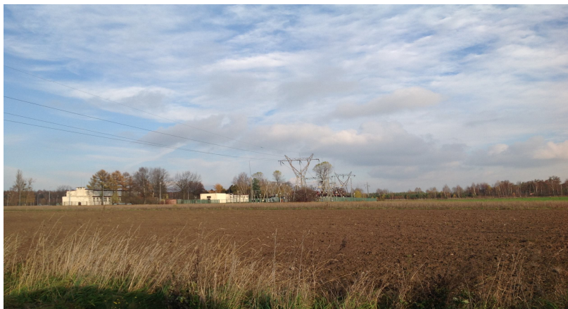
Zdj. 2 Pola w północnej części wsi Nowe Orzechowo

W północnej części opracowania znajdują się kompleksy leśne i rolne. Najcenniejsze zadrzewienia i zakrzewienia występują na prywatnych gruntach, wzdłuż krawędzi erozyjnej doliny Narwi, a szczególnie w głębokich krawędziach erozyjnych. Na terenie opracowania użytki leśne znajdują się w północnej części obrębu Nowe Orzechowo, w zachodniej części jako zadrzewiony wawóz i w centralnej części wsi przy placu zabaw. Dominujące drzewostany to brzozy, sosny, topole, osiki, dęby, grusze polne, czeremchy, jeżyna, trzmielina. Wśród krzewów dominuje tarnina, a następnie róża polna, głóg, bez, jeżyna, trzmielina.