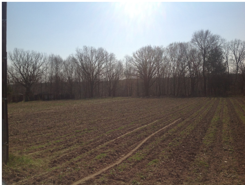
Zdj.5 Pola w sąsiedztwie krawędzi erozyjnych

Ze względu na relatywnie dobre warunki geotechniczne, krajobraz rolniczy w wolnym tempie przekształca się w krajobraz z rozproszoną zabudową jednorodziną i skupioną zabudową letniskową wzdłuż krawędzi erozyjnych. Krajobraz obszaru jest dość jednorodny pod względem rzeźby. Jedynymi jej wyróżnikami są lokalne zagłębienia. Na polach, drogą wtórnej sukcesji pojawiają się drzewa i krzewy.