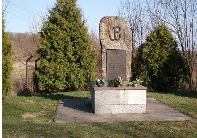
Tablica informacyjna przy III Fortcie w Pomiechówku