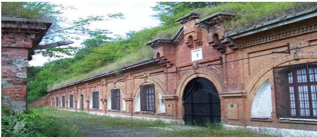
Fort III Pomiechówek.