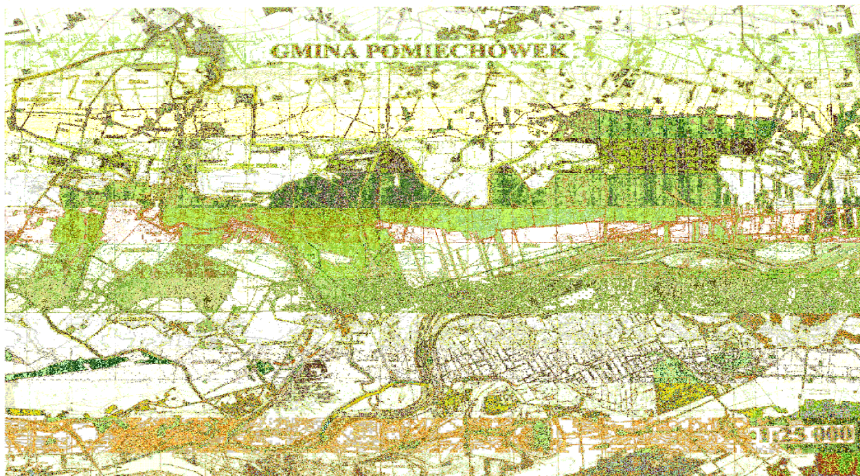
Mapa Gminy Pomiechówek