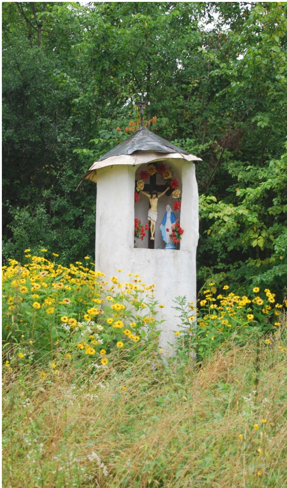
Figurka Matki Bożej w Szczypiornie

W Szczypiornie dominują gospodarstwa zagrodowe, które do niedawna były jeszcze drewniane. Jednak niewiele z pierwotnych zabudowań ocalało do naszych czasów, a te które jeszcze istnieją znajdują się w słabej kondycji.