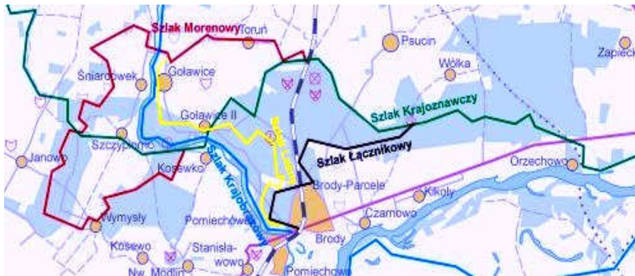
Rys.2. Mapa szlaków turystycznych w Gminie Pomiechówek