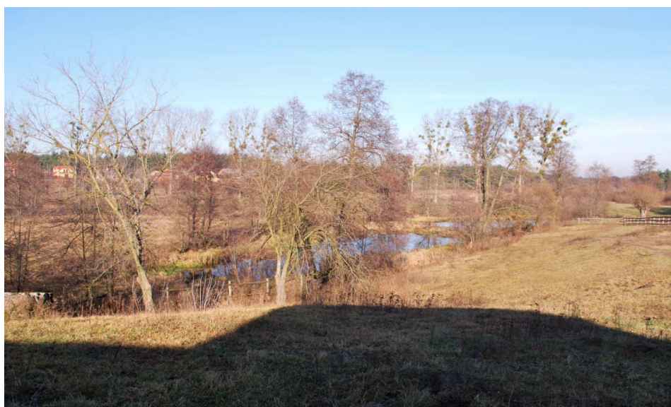
Oczka wodne w Szczypiornie

Dowodem na to, że ukształtowanie powierzchni wsi wpływ miała płynąca w innym korycie Wkra, jest występowanie oczek wodnych w dolinie wsi, w bliskiej odległości od rzeki.