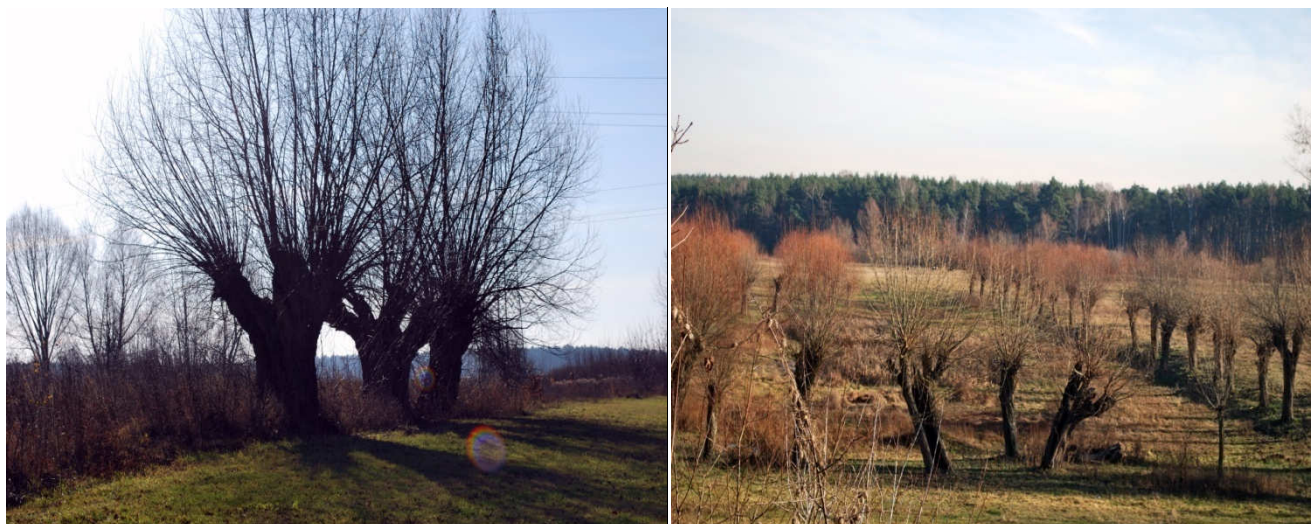
Wierzby w dolinie Wkry w Szczypiornie (teren wspólnoty gruntowej)

Podobnie jak większość Sołectw w Gminie Pomiechówek, Szczypiorno leży na Obszarze Chronionego Krajobrazu utworzonego na podstawie Rozporządzenia Wojewody Warszawskiego z dnia 29 sierpnia 1997 roku. Jest to obszar bardzo cenny nie tylko przyrodniczo, ale także pod względem możliwości zaspokajania potrzeb związanych z masową turystyką i wypoczynkiem.