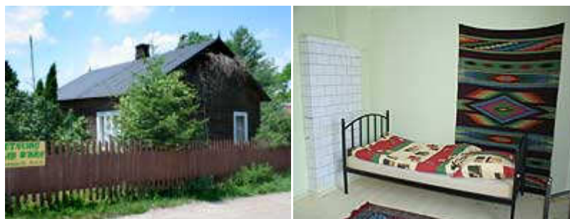
„Letnisko nad Wkrą” 27

Mimo wysokiej dbałości właścicieli o stan kwater istnieje jeszcze przed nimi wiele wyzwań, aby ich gospodarstwa były konkurencyjne dla innych gospodarstw położonych nad morzem, czy w górach.