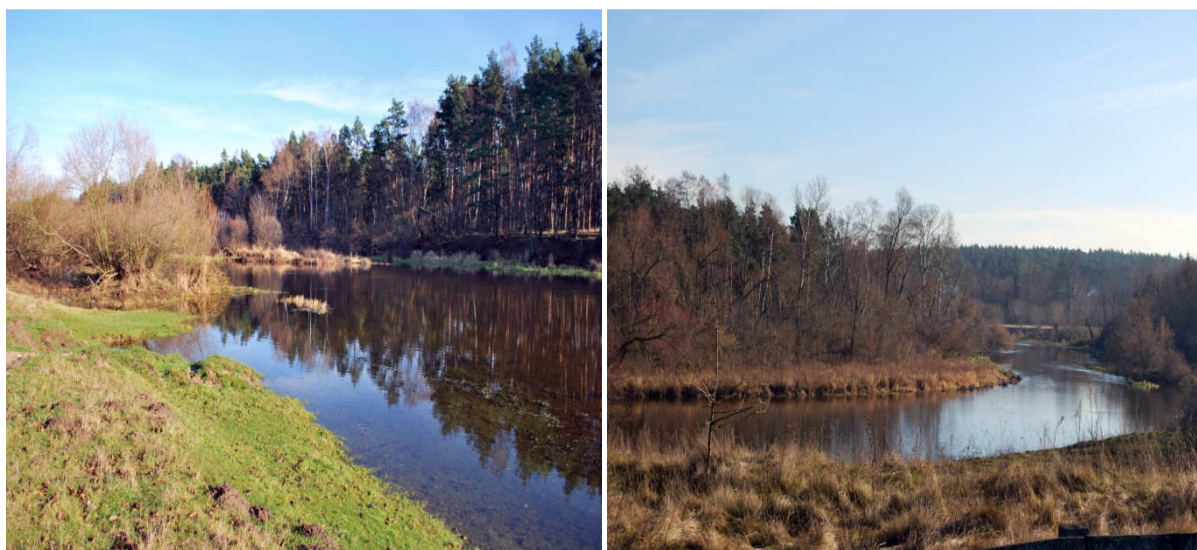
Zakole rzeki Wkry w Szczypiornie (teren rezerwatu „Dolina Wkry”)

Najmocniejszym atutem Szczypiorna jest przepiękne i niezdegradowane środowisko przyrodnicze. Ponad połowa powierzchni wsi to lasy. Jedynym pomnikiem przyrody jest jesion wyniosły o obwodzie 3,1 m i wysokości 28 metrów znajdujący się przy leśniczówce Szczypiorno. 21