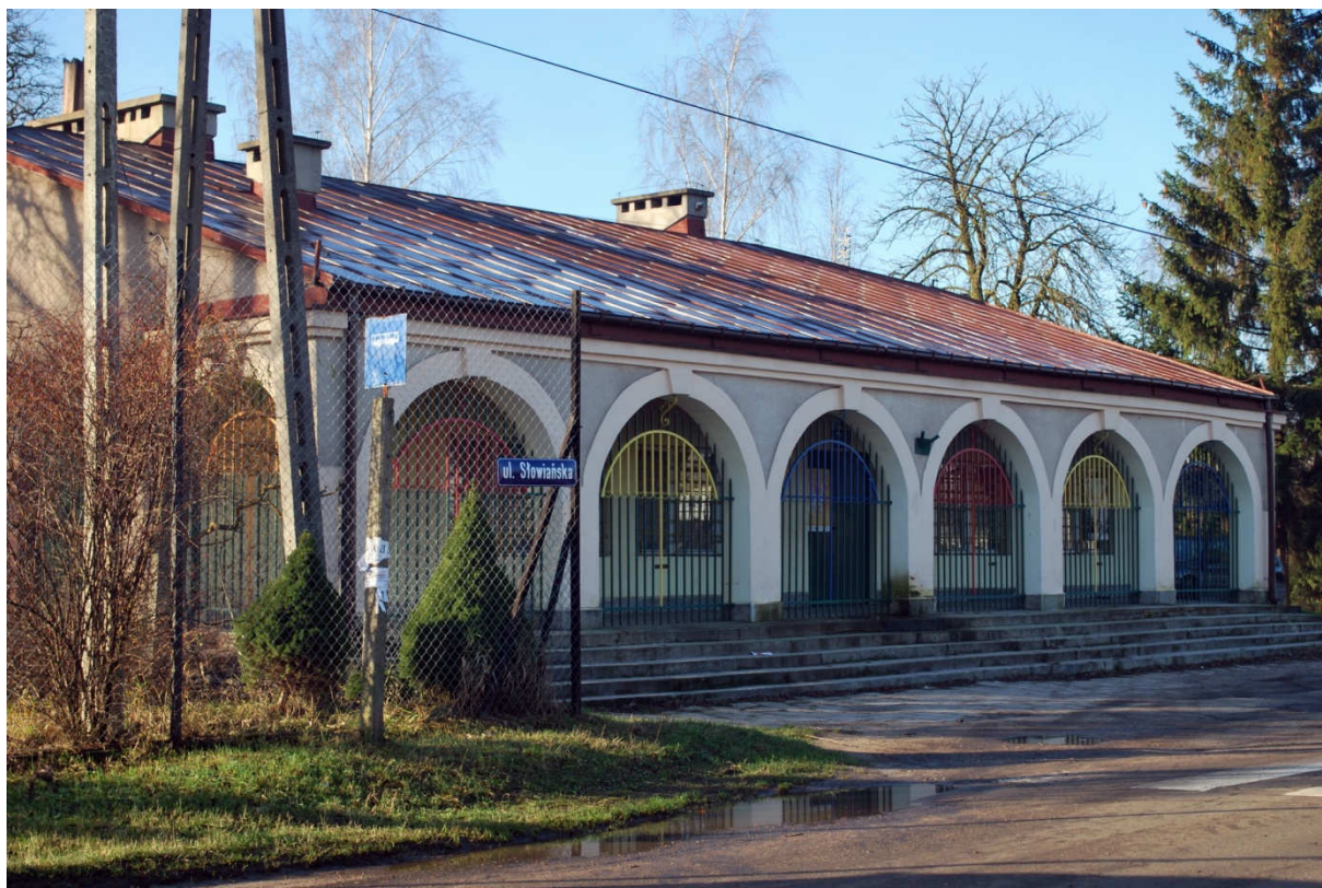
Budynek komunalny – siedziba Ogniska „Pod Parasolem” prowadzonego przez TPD