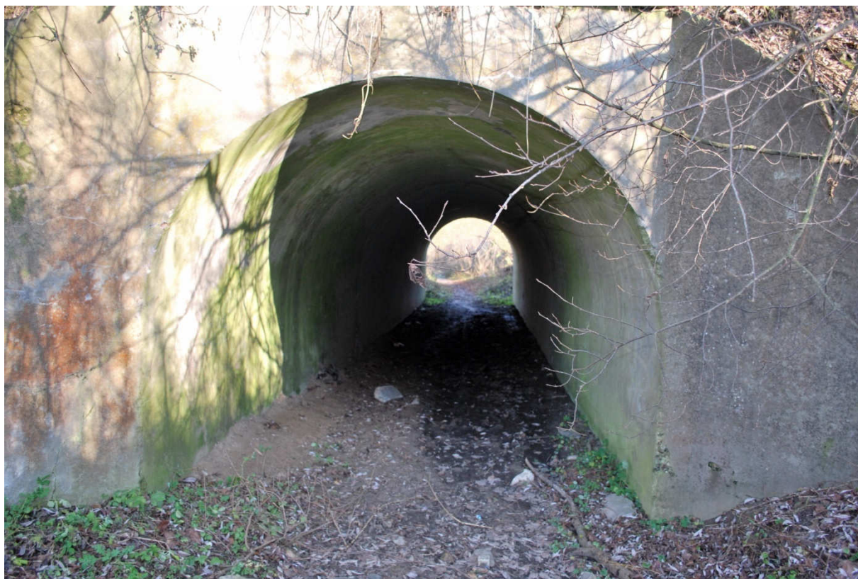
Mostek nad parową w Szczypiornie

Trwałe pamiętki historyczne odnaleźć można w charakterystycznej pozostałej jeszcze gdzieś tam architekturze drewnianych domów. Swoistą „pamiętką” po zaborze rosyjskim jest kamienna droga ze Szczypiorna do Wymysłów nazywana zwyczajowo „carską” oraz mostek nad parową na początku wsi.